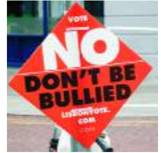
Irischer Protest gegen Lissabon-Verträge der EU

ung zum kürzlich in Irland gescheiterten Lissabon-Vertrag der EU. Denn der Lissabon-Vertrag (der der EU-Bevölkerung als ein mehr an Demokratie verkauft wird) hebt nicht nur die Entscheidung der Mitgliedsparlamente über Kriegseinsätze aus, sondern verpflichtet die EU auch zu „Integration aller Länder in die Weltwirtschaft“, „Abbau von Beschränkungen des internationalen Handels“ etc. – Konkret bedeutet dies die Durchsetzung einer neoliberalen Wirtschafts- und Handelspolitik. Diese Politik-Ziele können nicht im Sinne einer solidarischen Nord-Süd-Beziehung sein.