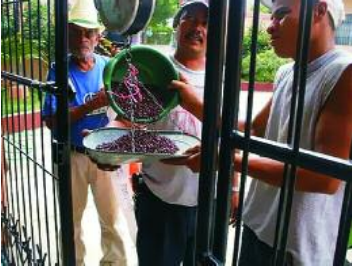
Verteilung von Bohnen als Saatgut