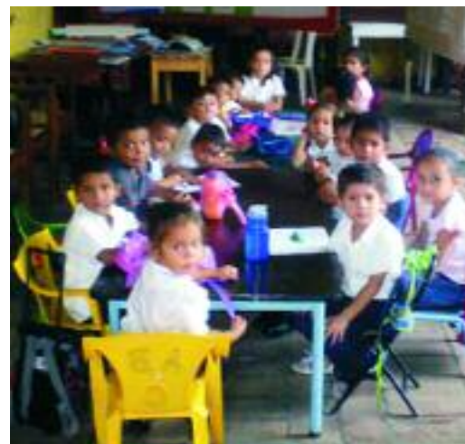
Eine Vorschulgruppe im Frauenzentrum

Bitte helfen Sie mit Ihrer Spende, die wichtige Arbeit des Frauenzentrums weiterhin zu ermöglichen und auszubauen. Spenden bitte unter dem Stichwort „ Frauenzentrum “. (se)