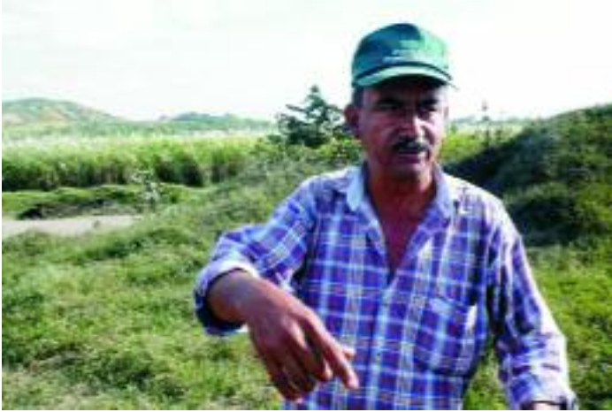
Einer der Anführer der Streikenden