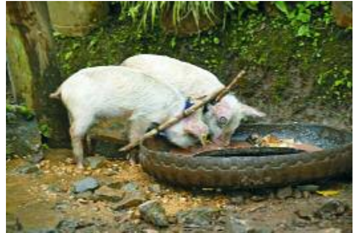
Ferkel von Kleinbauern

Seit der Einführung des Programms Anfang 2007 haben laut MAGFOR-Statistik 12.000 Familien die Nahrungsmittel-Produktionshilfe erhalten. Sie besteht aus einer trächtigen Kuh, einem Schwein und seinen Jungen, Hühnern und einem Hahn, Material zum Bau eines Hühnerstalles und eines Schweinestalls, Saatgut,