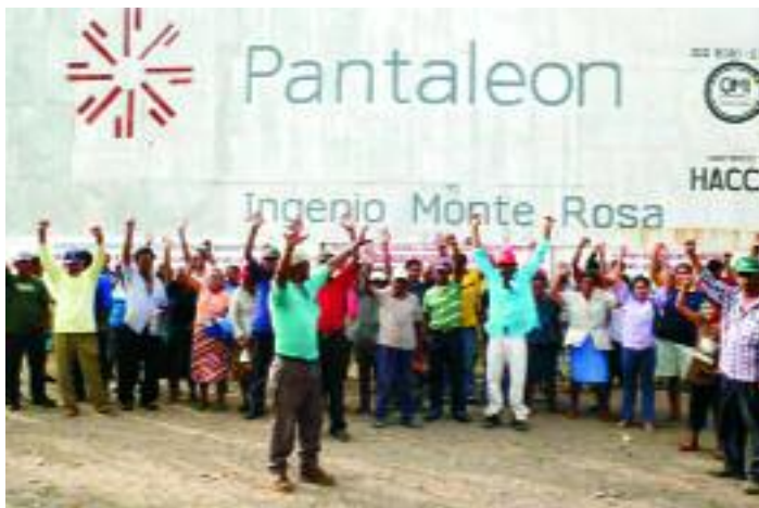
Streikende ArbeiterInnen vor dem Ingenio

Weniger im Focus der Öffentlichkeit stehen bislang die gesundheitlichen und sozialen Folgen der Intensivierung des Anbaus dieser „Energieträgerpflanzen“. Wir wollen diese Diskussion durch ein Beispiel aus Nicaragua erweitern.