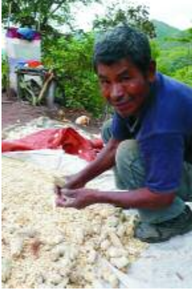
Kleinbauer mit seiner Maisernte

Förderung der Exportproduktion statt einer Grundnahrungsmittelversorgung zur Grundbedingung für Kredite gemacht hatten, versuchen mit dem lauten „Halt den Dieb!“ von der eigenen Verantwortung abzulenken. Die bisher durch Kreditfinanzierung geschaffenen Grundlagen für den Hunger sollen nun mit neuen Krediten gegen den Hunger wieder neutralisiert werden.