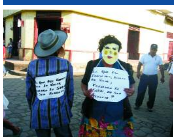
Straßenaktion der Frauen zum Welt-Aids-Tag

Das Nicaragua-Forum finanziert weiter die Arbeit der Elternorganisation Los Pipitos. Spenden für die laufende Arbeit der Organisation bitte unter dem Stichwort „Los Pipitos“.